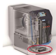
B-DETECTION PLUS i