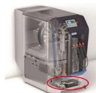
B-DETECTION PLUS i